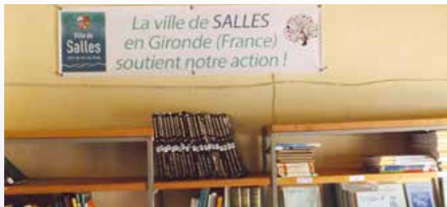
Bibliothèque Françoise Labesque, Safané, Burkina Faso