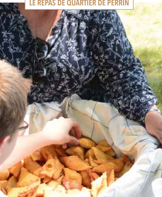
Les merveilles de Dani

C'est en 2001 que les habitants de Perrin ont décidé pour la première fois de se retrouver pour un moment de partage. D'abord dans les hangars situés chemin du Pujeau puis à l'ombre de grands chênes, chemin du Tretin. Après un apéritif convivial, préparé et