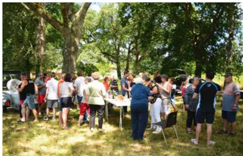
Rassemblement autour de l'apéritif