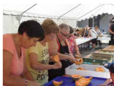
Les bénévoles s'activent au stand restauration