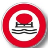
Véhicules transportant des produits de nature à polluer les eaux.