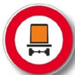
Véhicules transportant des matières dangereuses