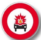
Véhicules transportant des produits explosifs ou facilement inflammables.

Le transport routier est réglementé par des législations européennes (règlement ADR, accord européen pour le transport international de marchandises dangereuses par route) ou internationales. En France l'application de ces accords est précisée dans l'arrêté ministériel du 29 mai 2009 (dit « arrêté TMD»). Des contrôles réguliers sont effectués par les forces de l'ordre et les services de l'état. Une signalisation spécifique s'applique à tous les moyens de transport : camion, wagon SNCF, container. En fonction des quantités transportées, le véhicule doit être signalé par des plaques orange réfléchissantes.